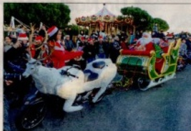
Certaines motos ont fait l'objet d'une surprenante customisation de circonstance... approuvée par le Père Noël en personne!