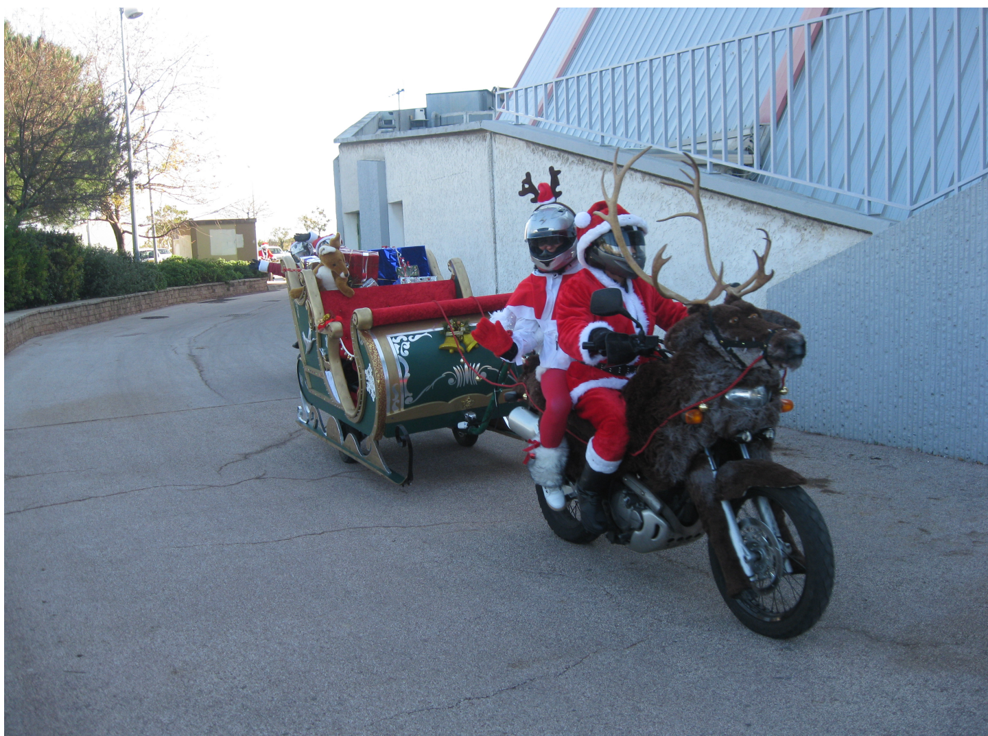
2011 premier renne et son père Noël avec le traîneau

En Décembre 2009 cinq amis motards se sont lancé un pari qu'ils croyaient fou. Parcourir les villes et villages du littoral Varois sur leur moto décorée et déguisés en Pères Noël pour les garçons et en Mères Noël pour les filles.