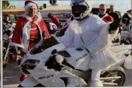
Une soixantaine de Mères et Pères Noël motards s'étaient donné rendez-vous avant de démarrer un petit périple ouest-varois.