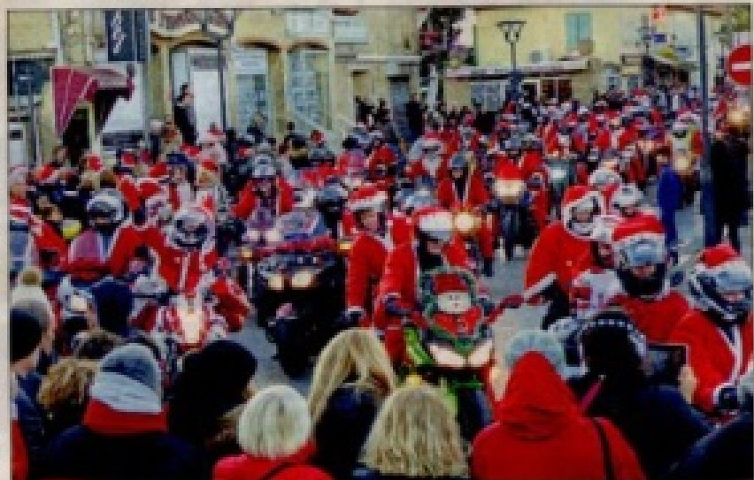
Carriée des Pères Noël motards du Var, vrombissante association de La Londe, a fait forte impression.