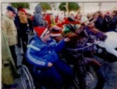
Cette journée a fait le bonheur de tous.