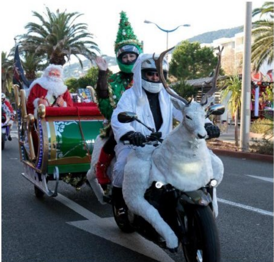
Ils avaient tout l'attirail nécessaire.