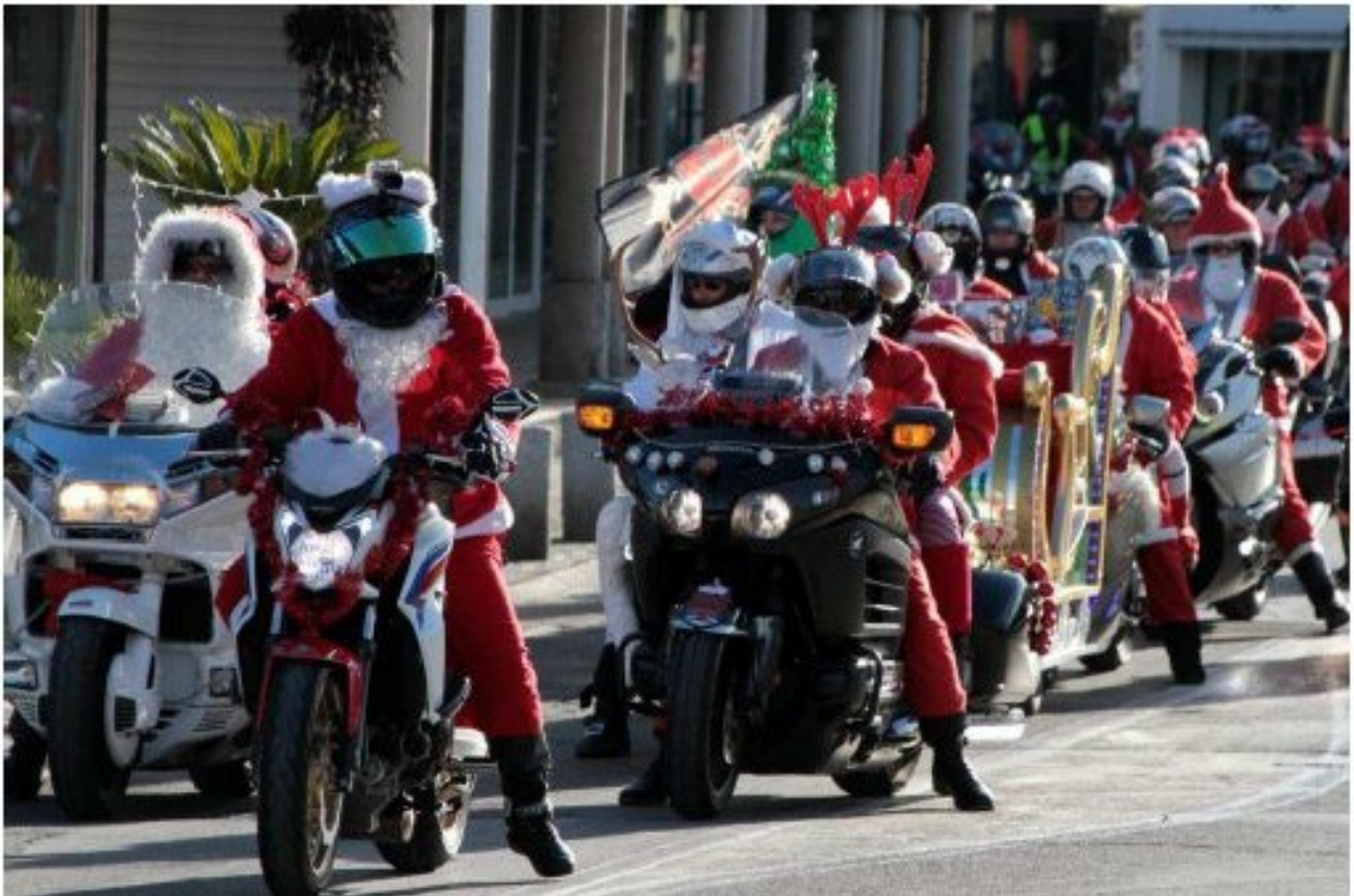
Les Pères Noël à moto sont arrivés en très grand nombre.

Cette folle journée se terminera par un goûter des petits lutins.