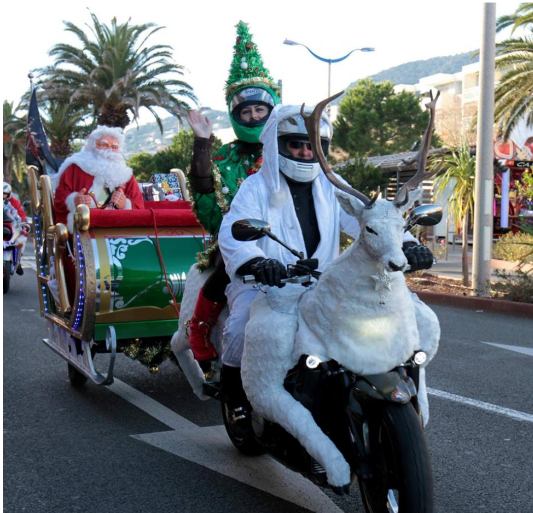
2017 le troisième renne