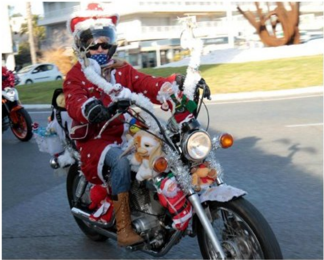
Ils étaient des dizaines à animer les rues.