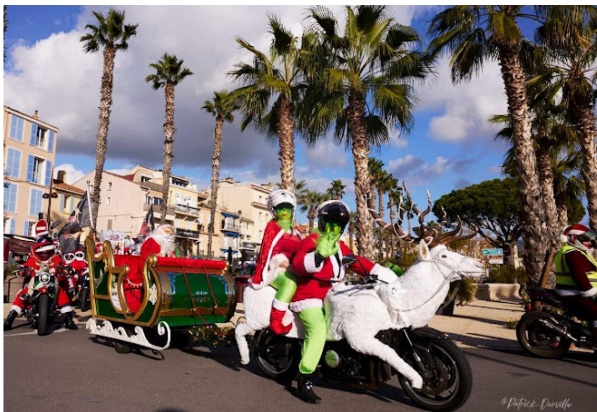
2022 le Traineau à Bandol