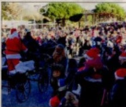
Le Père Noël est arrivé en début d'après-midi en calèche, sous les acclamations de la foule.